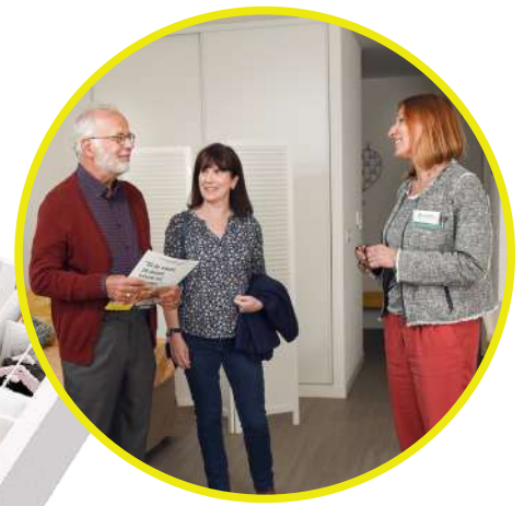
*Plan non contractuel